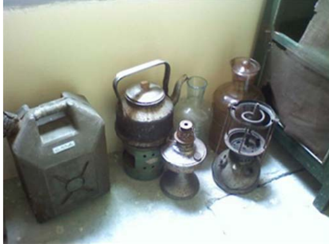
Một số đồ dùng khi bị ở tù

Con không có gì hết, dù một xu cũng không, trừ tràng chuỗi Mân côi, và ý thức Chúa Giêsu, Mẹ Maria không bao giờ rời con.