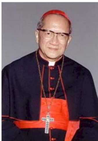
Đức Hồng Y Phanxicô Xavier Nguyễn Văn Thuận, 1975

Viết xong tại Cây Vông, Phú Khánh, nơi quản thúc, ngày 8 tháng 12, 1975.