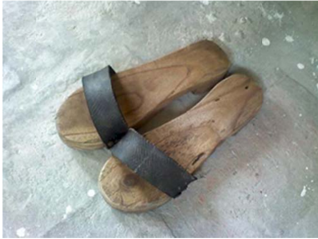
Đôi guốc của ĐHY