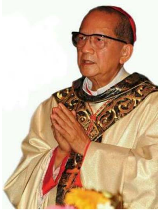
ĐHY Phanxicô Xavier Nguyễn Văn Thuận Cây Vông, Nha Trang Nơi tôi bị quản thúc Ngày 16 tháng 8, 1975 hôm sau Lễ Đức Mẹ Lên Trời

Chúa Thánh Thần. Alleluia! Alleluia! Alleluia!