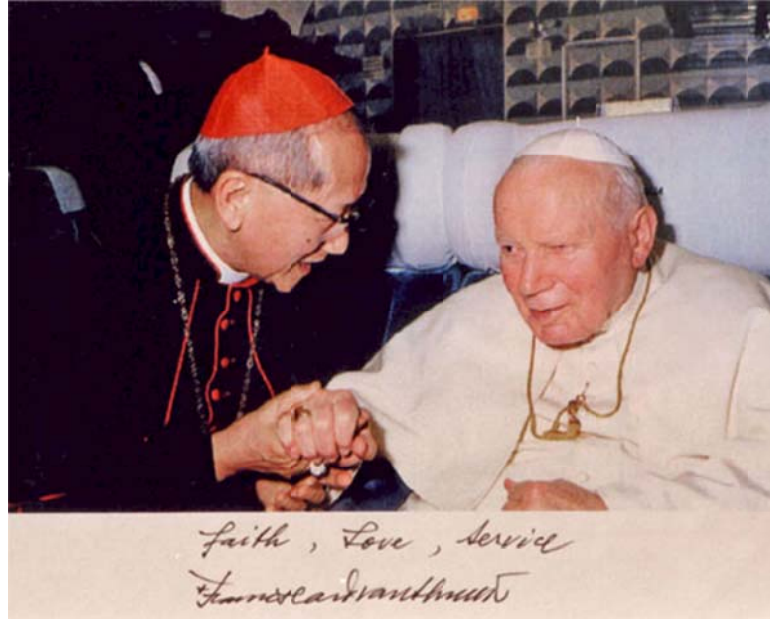
Những ngày sau hết với Đức Thánh Cha John Paul II.

Mỗi lần như thế tôi được dịp giang tay và đóng đinh mình vào thập giá với Chúa Giêsu và cùng Ngài uống chén đau khổ nhất. Mỗi ngày, khi đọc lời truyền phép, với tất cả tâm hồn, tôi làm lại một giao ước mới, giao ước vĩnh cửu giữa tôi và Chúa Giêsu, hòa lẫn Máu Ngài với máu của tôi. Đó là những Thánh Lễ đẹp nhất trong đời tôi!