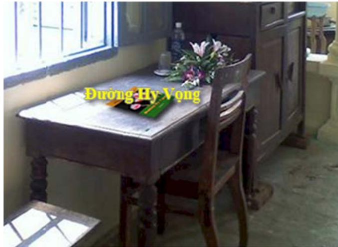
Bàn viết nơi Đức cố Hồng Y đã viết "Đường Hy Vọng"

Tôi không chờ đợi. Tôi sống phút hiện tại và làm cho nó đầy yêu thương.