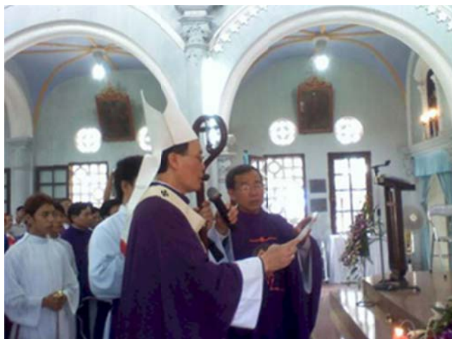
Đức Giám Mục Ngô Quang Kiệt cử hành thánh lễ kính nhớ Đức Hồng Y Phanxicô Xavier Nguyễn Văn Thuận.

Hình ảnh những kỉ vật của Đức cố Hồng Y được lưu trữ tại giáo xứ (Chú ý: trang điện tử này không còn hiện diện trên mạng nữa)