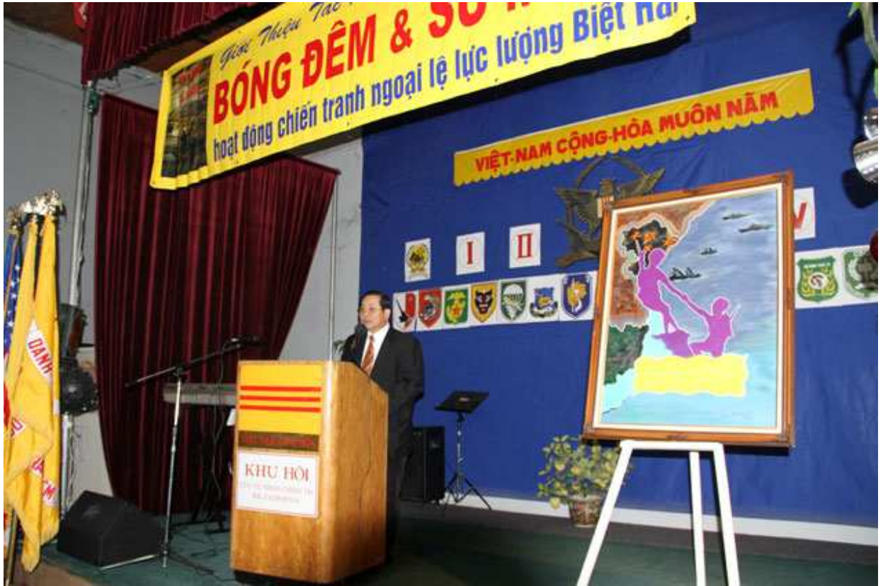
Nghi thức chào cờ Mỹ Việt và phút mặc niệm