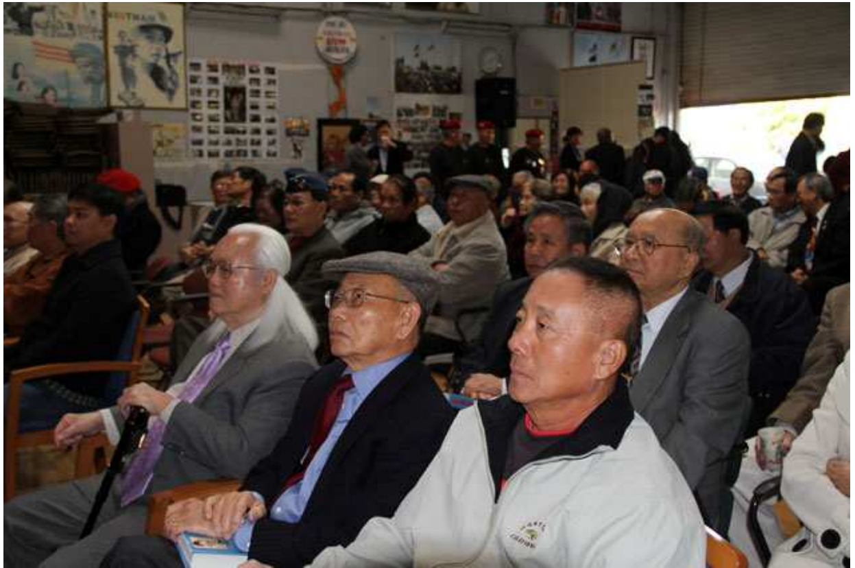
Quan khách tham dự