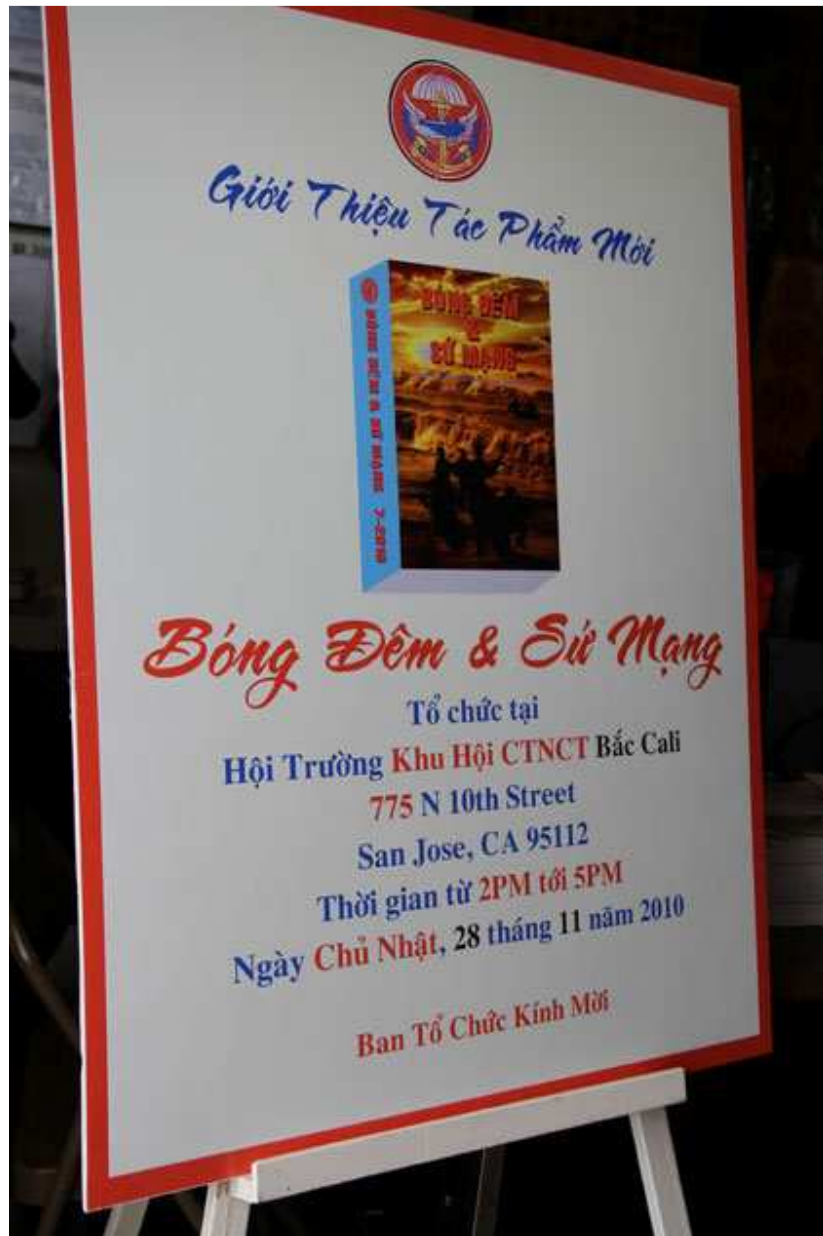
Bảng giới thiệu buổi ra mắt sách Bóng Đêm & Sứ Mạng