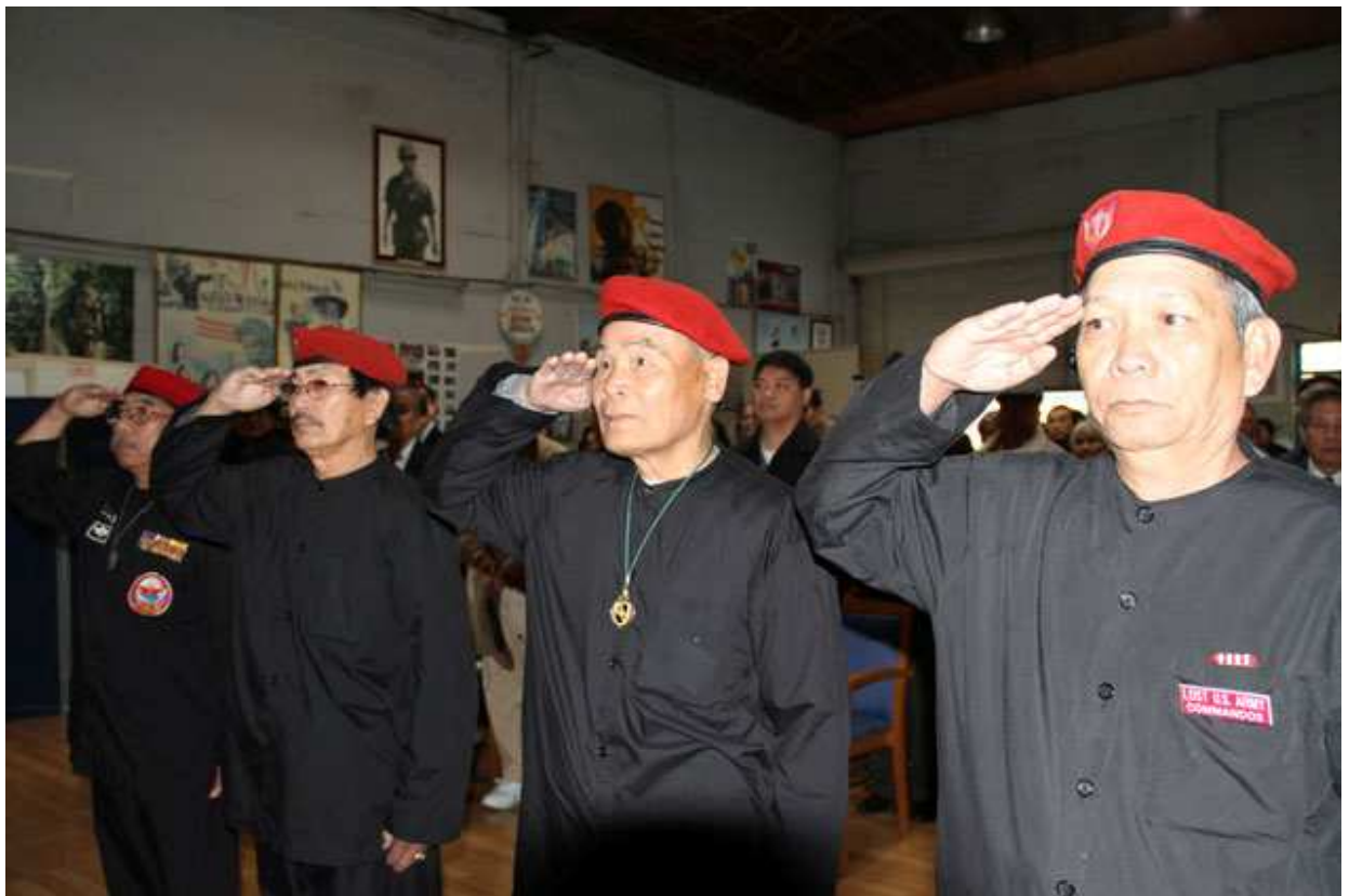
Ngũ thức chào cờ Mỹ Việt và phút mặc niệm