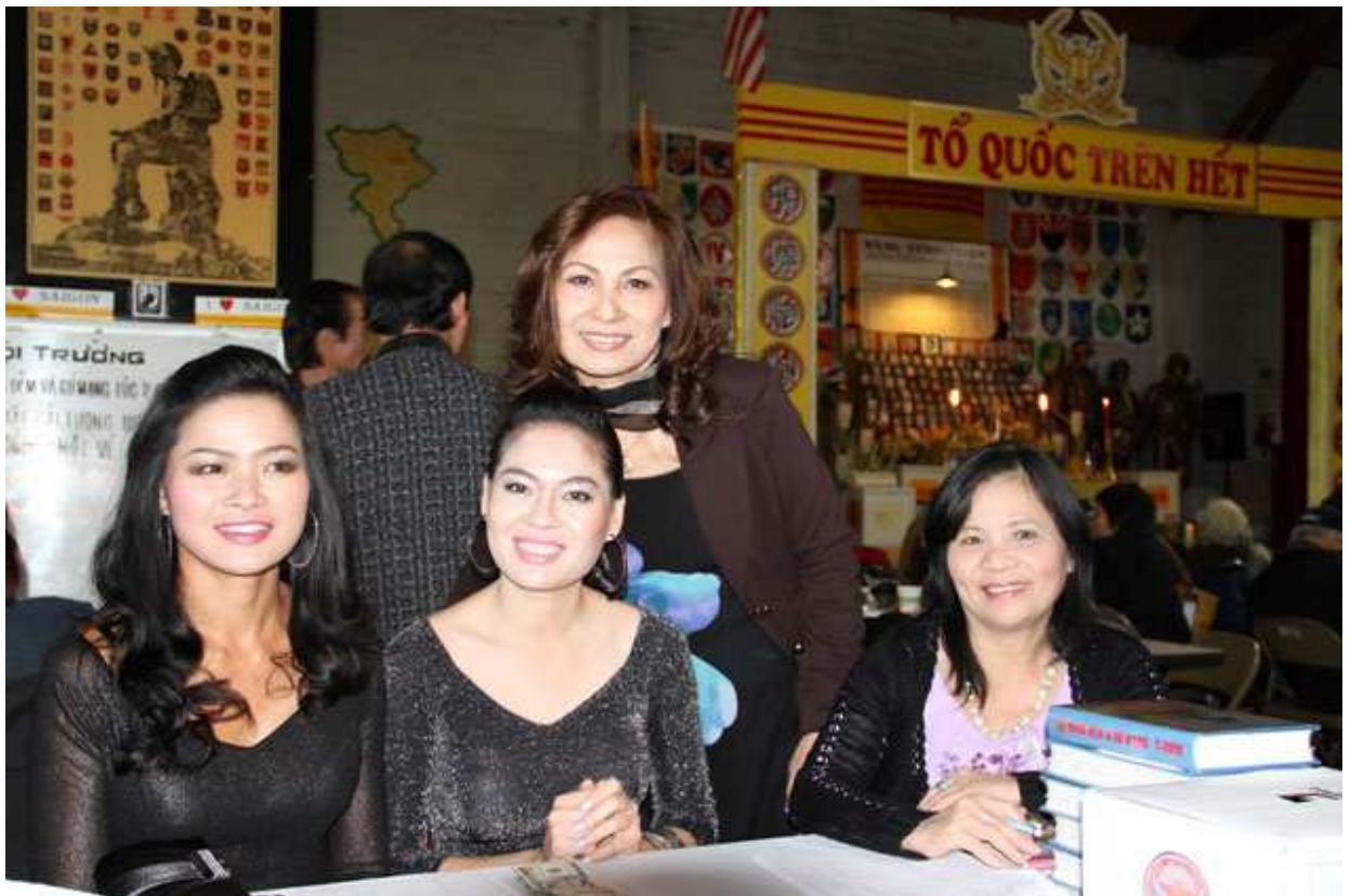
Những Bông Hồng BIỆT HẢI