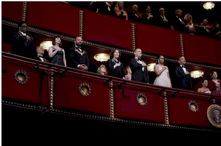
Tổng Thống Barack Obama và Đệ Nhất Phu Nhân tại buổi vinh danh những nghệ sĩ Hoa Kỳ, Kennedy Center, ngày 7 tháng 12, 2014

Buổi trình diễn sẽ diễn ra tại Eisenhower Theater. Với gần 1,200 chỗ ngồi, hí viện này được đặt tên để vinh danh vị tổng thống thứ 34 của Hoa Kỳ và cũng là vị anh hùng trong Đệ Nhị Thế Chiến: Dwight Eisenhower.