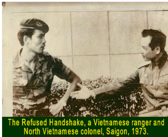
The Refused Handshake, a Vietnamese ranger and North Vietnamese colonel, Saigon, 1973.

The “peace talks” of 1972-73 were fraught with unease by many in the Republic of Vietnam who were weary of the true intentions of their Communist foes. Among the many facets of the talks was the establishment of the International Commission for Control and Supervision (ICCS). The commission was established on January 27, 1973, and its aim was to supervise the implementation of the cease-fire agreements. However, its task proved ultimately unattainable. Between January and July of 1973 there were an estimated 18,000 separate violations of the peace talks agreements.