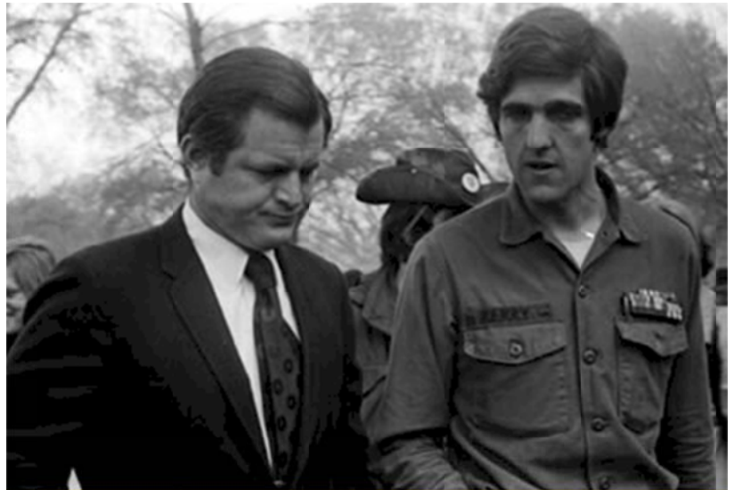
Thượng Nghị Sĩ Ted Kennedy (trái) và Trung úy John Kerry (phải), sau là TNS

Nhưng quốc hội với áp lực của “Phong trào Hòa Bình” đã thông qua dự luật vào tháng năm 1973. Sẽ là bất hợp pháp nếu Tổng Thống sử dụng bất cứ đồng nào trong công quỹ cho cuộc chiến tại Việt Nam, Lào và Cambodia. Làm như vậy, Quốc hội đã chuyển thắng thành bại. Quốc hội phản bội lời cam kết lịch sử của Hoa Kỳ là bảo vệ các nước không Cộng sản tại Đông Dương. Lúc ấy tôi làm việc tại Thượng nghị viện, nghị sĩ Ted Kennedy tuyên bố rằng “Việt Nam không cần giúp đỡ, họ đã có lượng vũ khí trị giá vô số triệu đô la”. Đó là sự thật. Việt Nam có phi cơ trực thăng, xe tăng Hoa Kỳ. Nhưng cái mà họ không biết là, Việt Nam không có đạn, không có xăng, không có phụ tùng. Đồng đô đó trở nên vô dụng. Đây là câu chuyện tôi chưa bao giờ kể cho ai nghe. Ngay sau khi sơ tán từ Việt Nam về tới Mỹ, tôi gặp Nghị sĩ Ted Kennedy tại Thượng Nghị Viện. Đó là lần đầu tiên tôi gặp ông ấy khi trở về Mỹ. Ông ấy đứng cách tôi khoảng 3 mét. Tôi cung tay phải lên và tự nhủ: “mình phải cho nó biết tay, phải đấm gục hắn ta và nói cho thế giới biết rằng chúng tôi vừa mới phản bội chính danh dự của mình và bỏ rơi những người đáng yêu.”