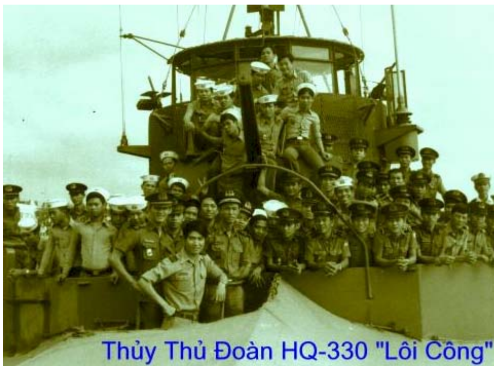
Thủy Thủ Đoàn HQ-330 "Lôi Công"