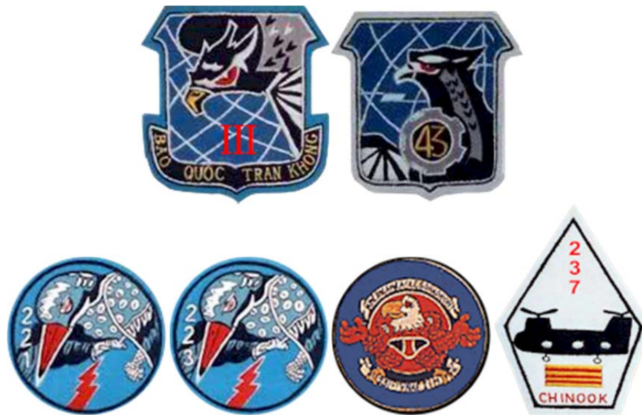
Huy hiệu SĐHKQ, KD43CT, & Các Phi Đoàn Trực Thăng vận trực thuộc: 221, 223, 231 & 237

Đoàn III Không Quân Biên Hòa. Thật là vô cùng phi lý nếu không nói là ngược ngạo. Trong khi các phi cơ của các Phi Đoàn Trực Thăng 221, 223, 231 237... phi cơ L-19 còn đang bay tìm kiếm và bốc các toán đã vượt qua được vòng vây địch thì tại hậu phương họ đang bị kết tội.