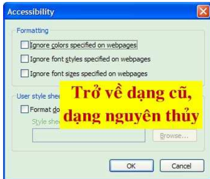
7. Hình số 4.

C. Cách xài trang MUC LUC : website LHCCS/HTĐ không quên cung cấp cho bạn đọc trang MUC LUC (được đặt dưới tận cùng, bên phải của mỗi trang). Mục đích của trang web này là để cho bạn thấy rõ được toàn bộ cấu trúc của mạng lưới LHCCS/HTĐ trên một trang điện tử liên tục mà không bị ngắt quãng như các trang điện tử bình thường. Trang Mục Lục được thành lập dùng mẫu giấy mà đa số chúng ta thường thấy trong các ngành như kiến trúc hay hội họa với nền trắng và ô vuông màu xanh dương để giúp các bạn có mắt yếu đọc và theo rõi website này một cách dễ dàng và thoải mái. Bạn chỉ cần bấm vào các link trong trang Mục Lục thì sẽ được hướng dẫn đến trang điện tử của LHCCS/HTĐ mà bạn muốn xem.