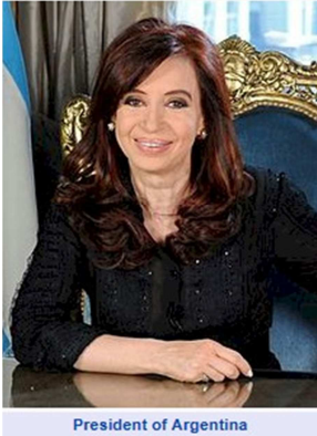
Cristina Fernández de Kirchner

Hôm thứ Sáu 15 tháng 2, 2013 vừa qua, Tòa thánh Vatican đã phủ nhận những lời tố cáo của phong trào “chống ảnh hưởng Tu sĩ” rằng Giáo Hoàng Phan-xi-cô đã không làm tròn bổn phận bảo vệ những Linh mục trong cuộc chiến được mệnh danh là “cuộc chiến bản thủ” do những nhà độc tài Á-căn-đình phát động hơn 30 năm về trước.