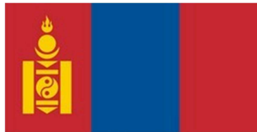
cờ Mông Cổ

Hagel bay đến Mông cổ ngày 10 tháng 4 năm 2014, nối tiếp bước đi của Tổng thống George W. Bush, Bộ trưởng Donald Rumsfeld năm 2005. Hai bên Mỹ, Mông đồng ý củng cố sự kết hợp, tăng cường mối liên hệ quân sự làm thế đối trọng với hai cường quốc láng giềng Nga và Tàu.