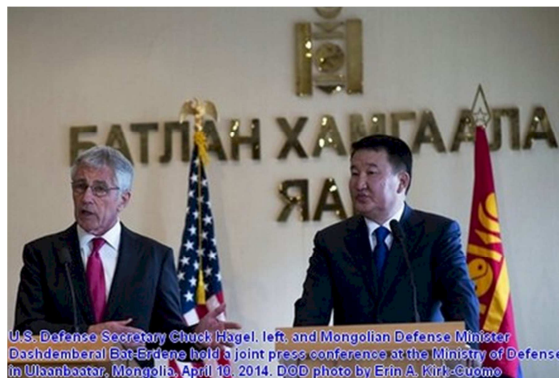
U.S. Defense Secretary Chuck Hagel, left, and Mongolian Defense Minister Dashdemberel Bat-Erdene hold a joint press conference at the Ministry of Defense in Ulsanbaatar, Mongolia, April 10, 2014.

Cuộc thăm viếng này làm Bắc Kinh thăm đôn Mỹ vừa múa quyền trên đại dương trước mặt vừa nắm thắt lưng... Tàu lên tiếng tố cáo Mỹ tìm mọi cách liên kết với các nước láng giềng Á Châu nhằm cản trở sự phát triển của Trung cộng.